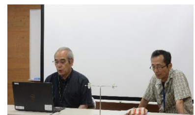
人権擁護委員協議会から