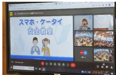
下学年の情報モラルの資料

午前中に、情報モラル教室を子ども達向けに行いました。1～3年生は、スマホ・ケータイ安全教室として、写真を撮る際に相手に許可を得たり、歩きスマホやながらケータイの危険性を考えたり、食事中や人が多い場での通話や音量に気をつけたり、通信型ゲームをする時間を決めたりすることを学びました。4～6年生は、上手な情報活用とリスクについて考えました。例えば、コミュニケーション編として、チャットでの友達への悪口やうわさ、からかいに対して、スタンプでのリアクションや良い悪いを言わないこと、言いにくい時は対面で伝えることを学びました。また、使いすぎ編として、好きな人とのSNS、お気に入りの動画、おもしろショート動画、ネットゲームのうち、自分がやり過ぎてしまうことを選んだり、その理由が内容の面白さや誘われる相手、サービスの機能のいずれによるものかを考えました。