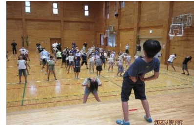
ラジオ体操の練習風景

先週の金曜日は、朝の時間に体育・保健委員会さんによる、ラジオ体操の練習がありました。夏休みの朝6時半から、各地区で行われると思います。私も子どもの頃、兄弟で毎朝、行っていました。途中に有田焼工業の工場があり、その外灯に集まるカブトムシを捕まえるのが楽しみでした。我が子の時は、朝、起こして行かせるためにカブトムシ捕りで誘っていました。保護者の皆さん、朝から大変かも知れませんが、どうぞ、宜しくお願いします。