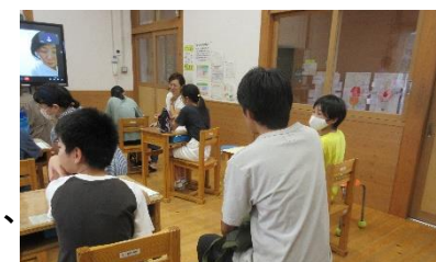
上学年の親子ルールづくり

これから、ご家族で考えられたルールを是非、実行されて、お子さんのより良い情報活用をめざしましょう。一方で、我が子にとって今、どのような体験や経験が必要であるかを考えていきましょう。私はバーチャルな世界とともに、目の前の自然界の生きものの観察や飼育等も大切だと考えます。