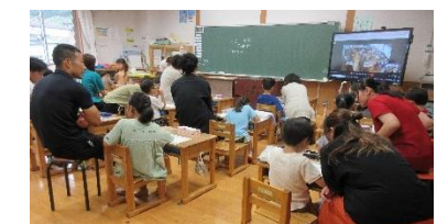
下学年の親子ルールづくり

最後に、人権擁護委員さんからネット社会における人権侵害が潜んでいて、誰もが加害者や被害者になり得ることを話していただきました。また、人権侵害やネット犯罪に遭った時の相談窓口も紹介されました。